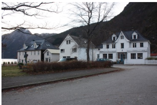
Bilde: Vadheim sentrum med Ferdamannen til venstre

Vadheim var lenge ein viktig samferdselsknutepunkt, handelsstad og industristad. Bygningsmiljøet i sentrum frå kaien og ut mot den gamle direktørbustaden Casa Blanca representerer fleire stilperiodar, som fortel om handel og aktivitet i skjeringspunktet mellom bondesamfunnet og industrisamfunnet. I dette kulturmiljøet er det mange viktige kulturminnekvatetar som ein må søke å ta vare på. Ein stadanalyse frå 2000 og ein konsekvensutgreiing frå statens vegvesen i samband med planlagd vegbygging på E39 frå mars 2015 peikar på desse elementa.