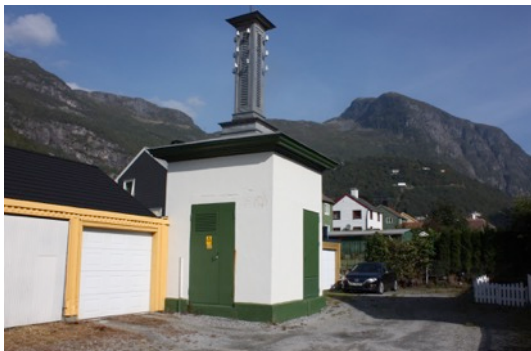
Bilete: Trafoskiosk i Høyanger sentrum

Autentisitet tyder at noko faktisk er slik som det gjer seg ut for å vere, om det er ekte og opphavleg. For at det skal gje mening, må autentisiteten alltid settast i samanheng med noko, til dømes: i forhold til tid, rom og/eller funksjon. Levetida til materialet er vesentleg når autentisitet skal vurderast. Som hovudregel vil det vere eit minstekrav til mengde originalmateriale i kulturminne for at det skal ha høg verneverdi. Ein bygning eller eit anna kulturminne kan vere i så dårleg forfatning at bevaring fører til ei så stor utskifting at autentisiteten vert svekka.