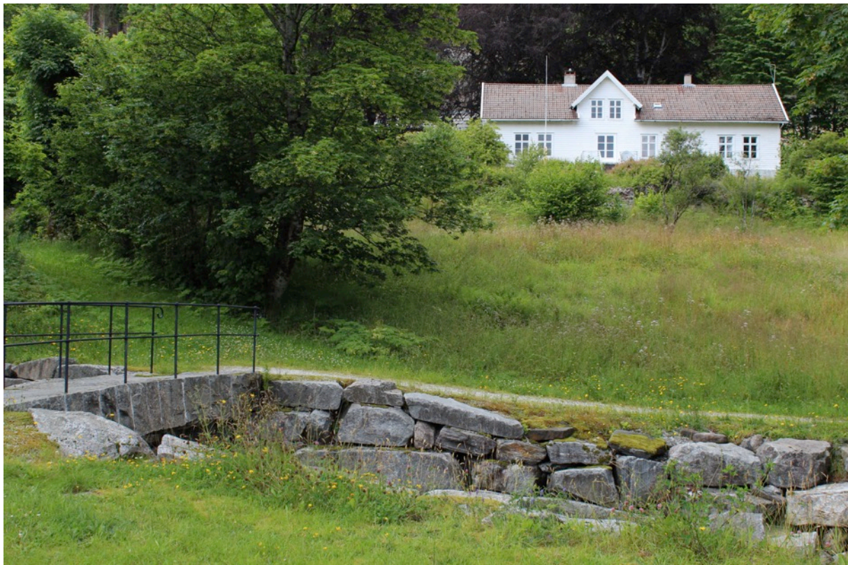
Bilete: Parti frå prestegarden i Lavik

Listeført kyrkjer: Alle kyrkjer bygde mellom 1650-1850 er listeførte. Ei rekkje kyrkjer bygd etter 1850 er òg listeført. Listeførte kyrkjer skal handsamast i høve til det såkalla kyrkjerundskrivet. Riksantikvaren skal gje fråsegn om endringar i eller ved kyrkja, og om istandsetjings- og vedlikehaldstiltak.