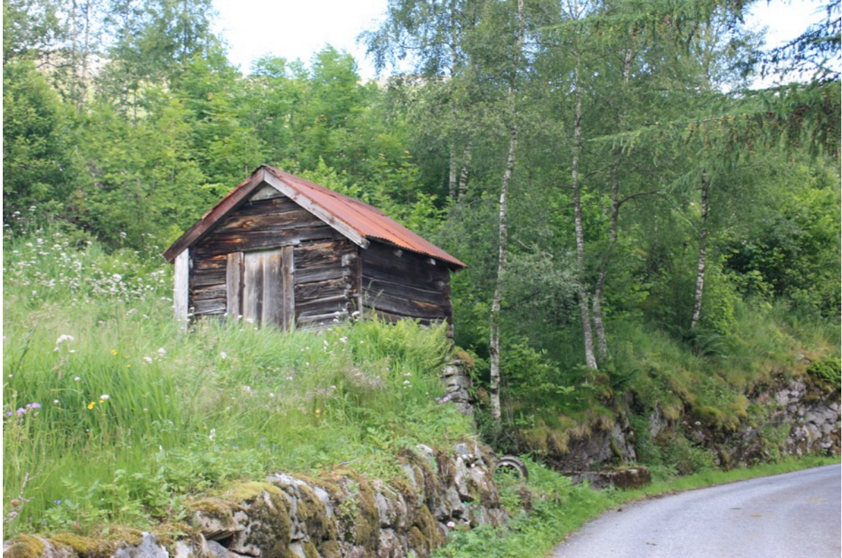
Kvernhus på Berge