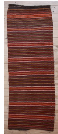
Bilete: Strikkevest i utstillinga til Høyanger Industristadmuseum. Skrin frå Bjordal, og åklede frå Måren som er i privat eige