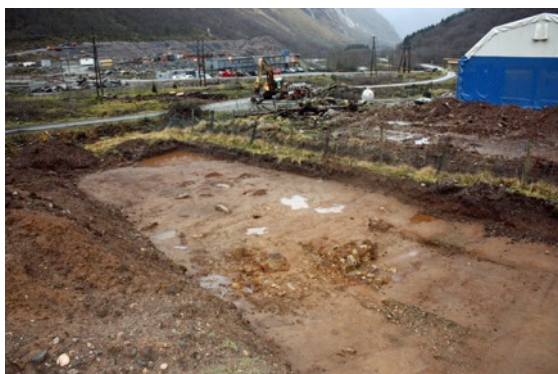
Bilete: Utgraving på Ekrene i Dalsdalen i Høyanger

I Høyanger kommune er det registrert 35 lokalitetar med automatisk freda faste kulturminne frå før 1537. Dei fleste av desse er registrert som gravminne. Elles er her buplassar, fangslokalitetar, stolar og kokegroplokalitetar. Desse er registrert i Riksantikvaren sin database Askeladden og kan og søkast opp på www.kulturminnesok.no Gjenstandar, lause kulturminne, er levert inn og oppbevart på museum. Fleire av desse kan søkast opp på og er kartfesta på www.unimus.no .