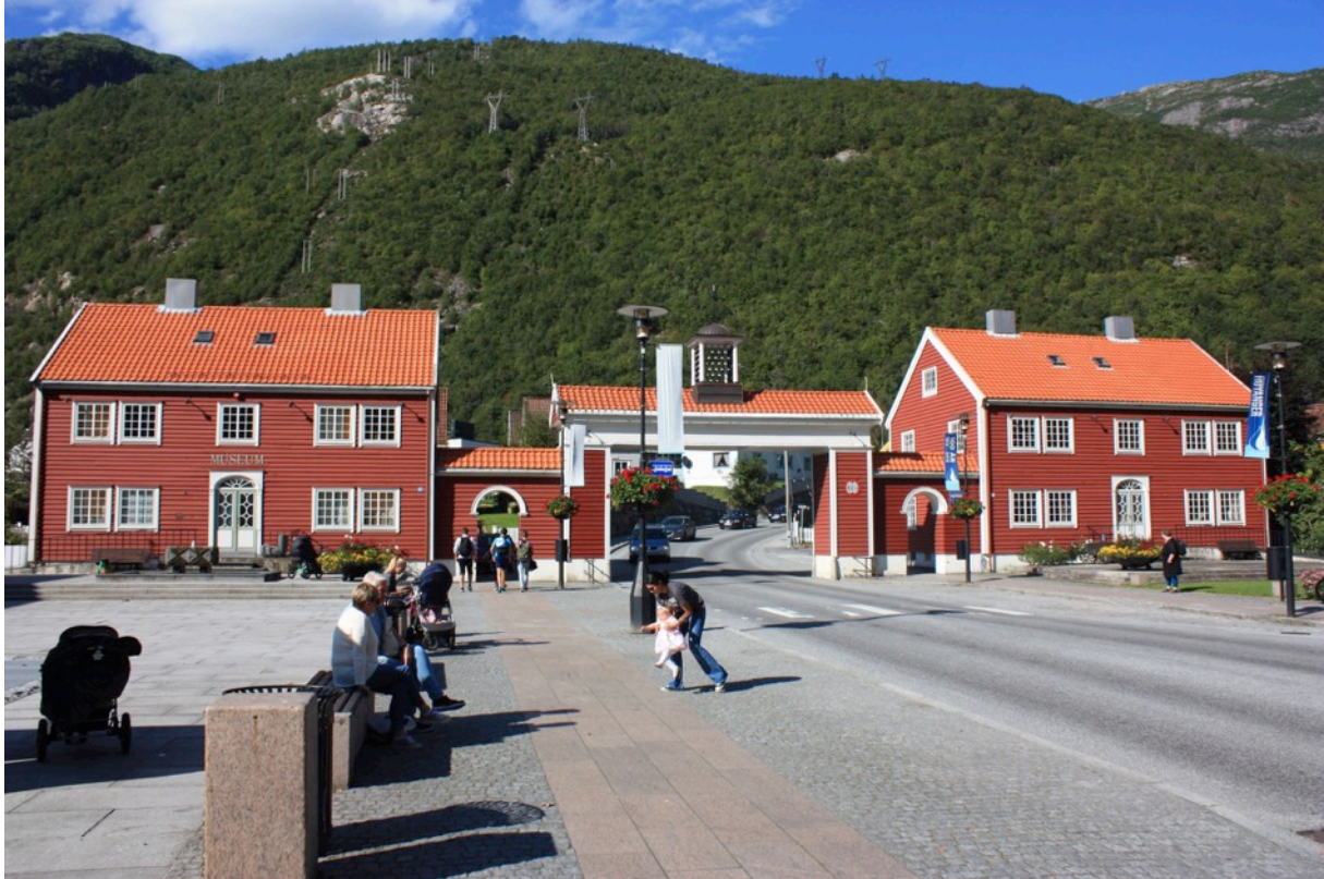
Bilete: Byporten og torget er eit mykje nytta område i sentrum som gjev oppleving