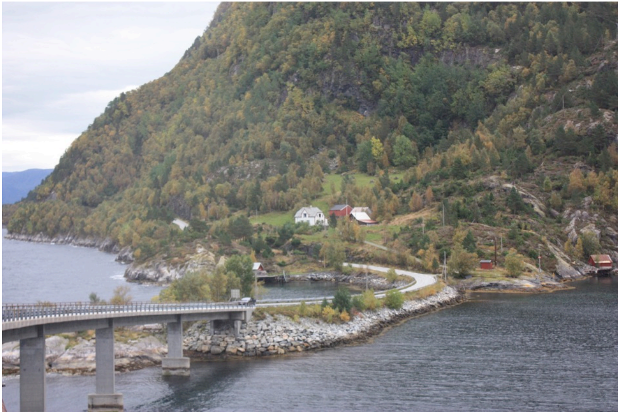
Bilete: Massnesberget ved inngangen til Ikjefjord