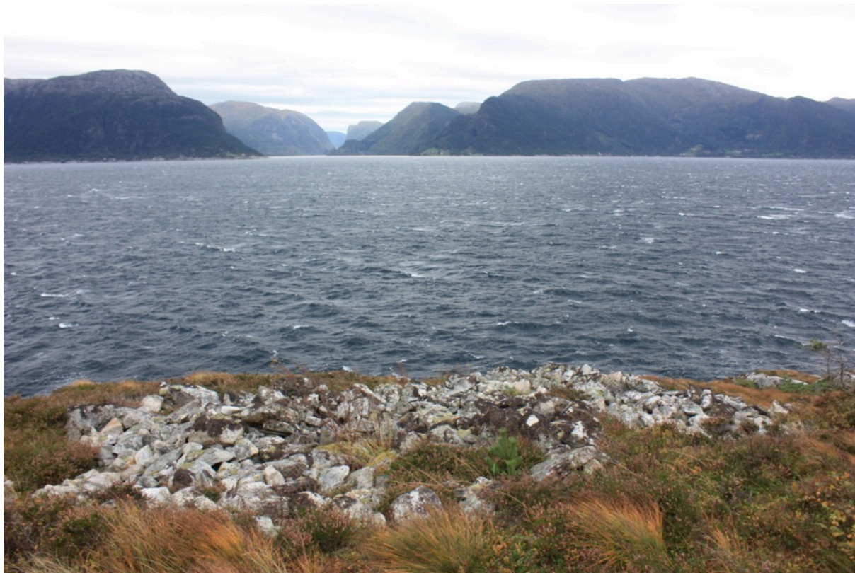
Bilete: Gravminne datert til bronsealder - jernalder på Verpekleiva på Åkre