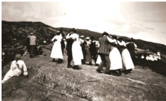
Bilete: Dans på Solnipa i 1920. I tida stølane var i drift samlast dei gjerne ein gong om sommaren til stølshelg. Søreide, Østerbø, Dyrdal og andre frå Strendene hadde stølshelg same helga. Då samla dei seg på Solnipa like ved fjellstølen til Dyrdal for dans og moro. Var det pent vēr kunne det fort vere 200-300 meneske samla her

Under samlenemninga immaterielle kulturminna er det mykje som kan publiserast. Her finn ein kvardagslivet, korleis folk utførte ulike arbeids-oppgåver i form av handarbeid-, handverks- og arbeidsmetodar, samt hendingar m.m. Her kjem og uttrykk som språk, diktning og musikk. Folketru som, segner, eventyr, forteljingar og overtru av ulik karakter kjem og inn her. Alt dette kan formast om til arkiverbart