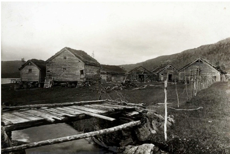
Bilete: Tun på Gudmundsos på Lavikdalen rundt 1930

Frå 1600-talet og frametter har vi relativt god informasjon om samfunnet med grunnlag i ulike typar kulturminner og frå skriftlege kjelder som til dømes skattelister (matrikkel), kyrkjebøker og rettsdokument. Det var det som ein kan beskrive som eit tradisjonelt bondesamfunn, der levevegen og næringsgrunnlaget i hovudsak var grunnlagt på jordbruk. Der prinsippa om sjølvberging og naturalhushald låg til grunn. Skogsdrifta var ei viktig binæring for mange. I den samanheng kan ein særleg nemne veden, som var ei viktig handelsvare. Der ein del lauvskog, ofte bjørk, vart hoggen kløyvde og transportert med jekter til Bergen og seld der. Fjorden var i den tida den viktigaste ferdselsvegen for bygdene langs Sognefjora, som var namnet mange nytta om fjordstykket i ytre Sogn. I sjøen var det og fisk å hente til matauk.