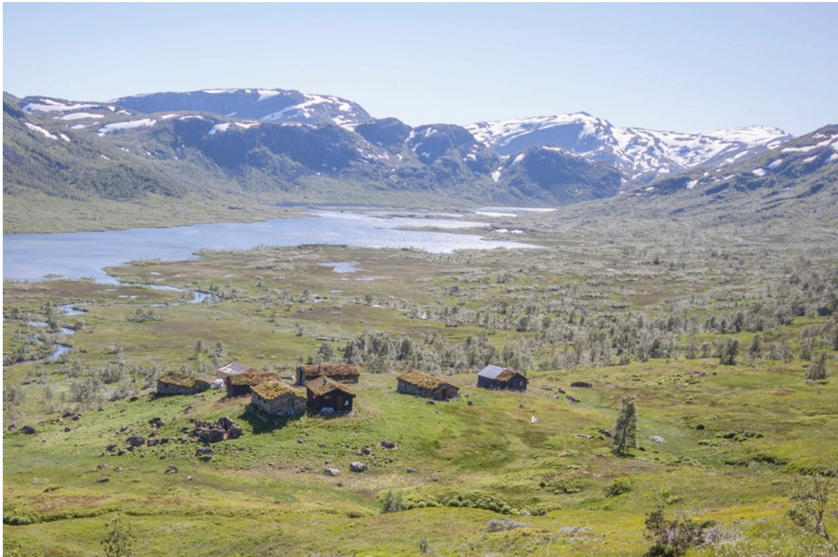
Solrenningane i Stølsheimen