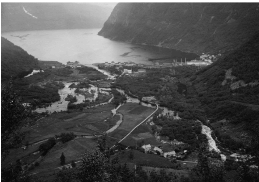
Bilete: Høyanger anno 1919

Det var ikkje berre eit omfattande omskifte på industristadene. Innfor jordbruket kom det til ei omstilling som for alvor tok til i vår del av landet mot slutten av 1800-talet. Jordbruksdrifta orienterte seg no meir mot marknad og pengehushald, og nye metodar for gardsdrift kom gradvis til.