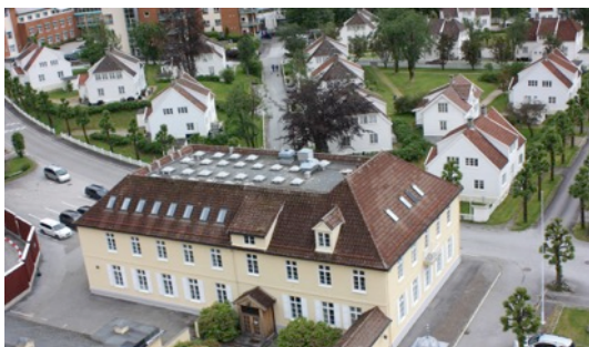
Administrasjonen til Hydro Aluminium Høyanger i starten av Storgata og regulerte og prosjekterte Parken. Alt tufta på byarkitektane Morgenstjerne & Eide sine planar

Eit anna viktig teknisk- og industrielt kulturminne når det gjeld straumforsyning er transformator kiosken i Hagegata frå 1928. Denne fortel ei viktig historie om straumforsyninga i Høyanger.