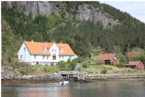
Bilete: Futegarden i Alværa

oppbygd i perioden 1916-1928. Den psykiatriske klinikken Fylkessjukeheimen Tronvik vart sett i drift i 1956, og i 2011 vart fleire sentrale bygg ved den forskriftsfreda.