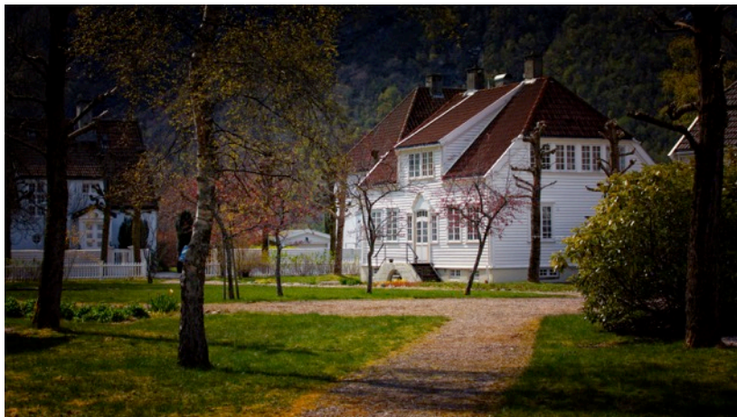
Bilete: Verne- og forvaltningsplan for Parken

Bruk av eksisterande bygningar og anlegg har langsiktige og positive effektar for miljøet. Dette kan vere ein vesentleg faktor som blir vurdert i høve til miljøbelastninga ved å rive og bygge nytt. Det vil i tillegg vere nødvendig å sjå på moglegheiter for gjenbruk av materialar ved ombygging eller riving.