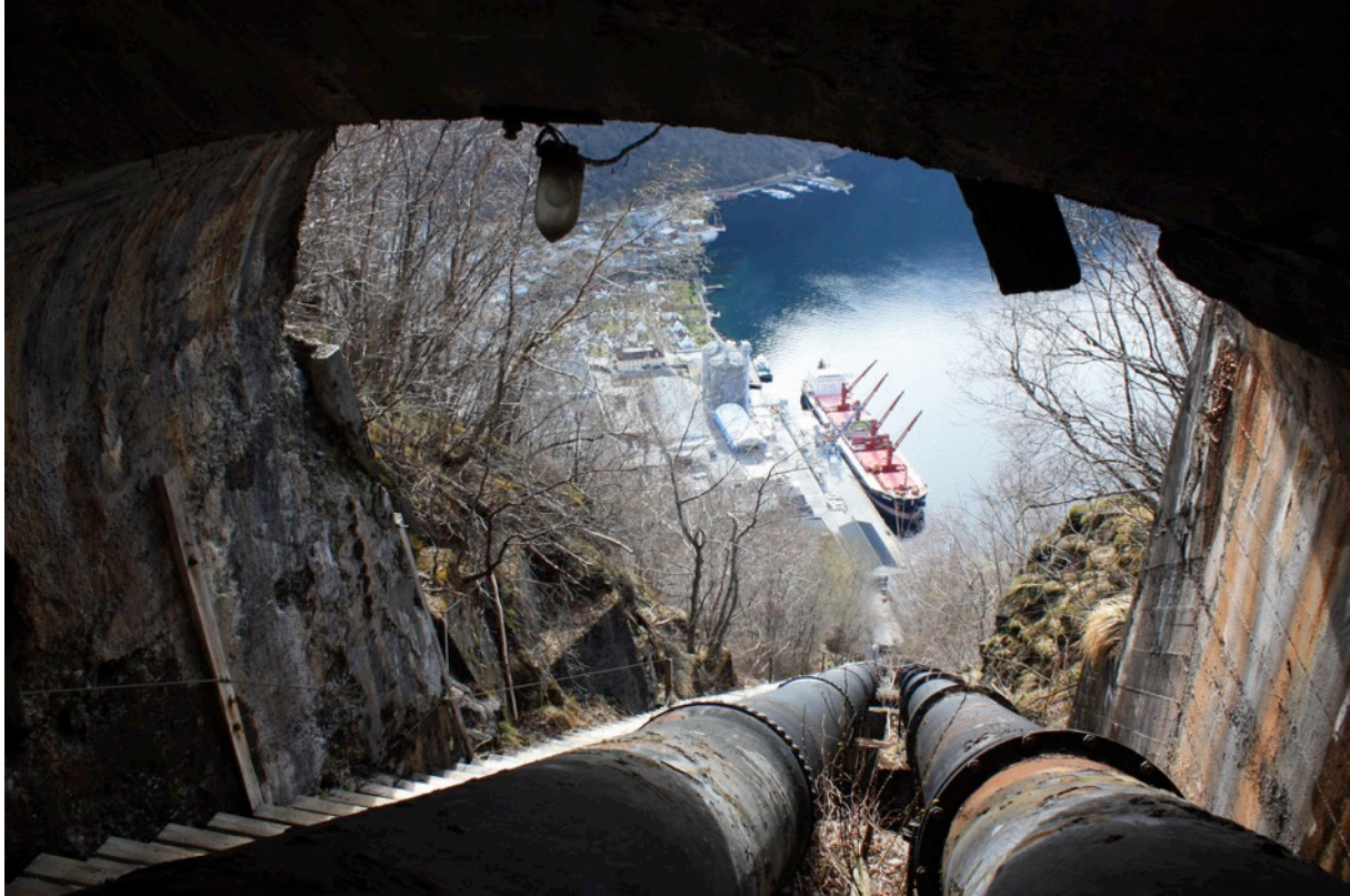
Bilete: Røyr gata ned til K1, samt trallebana