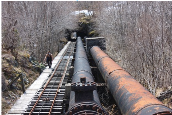
Bilete: Trappene til kraftanlegg 1 vert mykje nytta til rekreasjon

Eigarar vil normalt ta vare på bygningar og anlegg som framleis har ein bruksverdi, og er den enklaste og rimelegaste måten å verne på. Normalt vil kostnadene slik bli haldne nede gjennom jamleg bruk og vedlikehald. Dersom tilstanden er god, kan økonomiske og kulturhistoriske argument byggje kvarandre opp til fordel for vern.