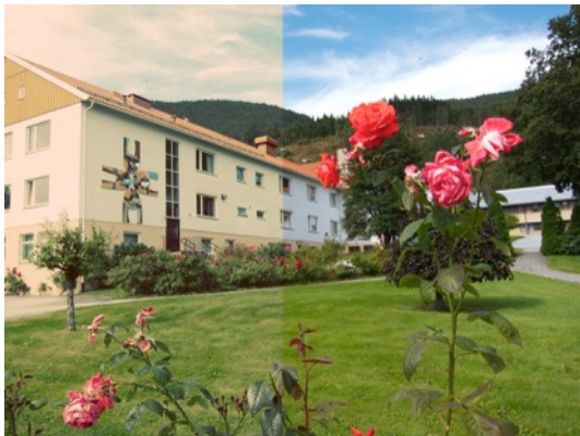
Bilete: Tronvik – Helse Førde

Representativt handlar om i kva grad eit eller fleire kulturminne er typiske eller karakteristiske for ei større gruppe kulturminne. Kriteriet kan brukast på to nivå, som overordna kriterium eller som kriterium for vurdering på objektnivå. På objektnivå kan det brukast for å samanlikna og prioritere slik at ein vel dei kulturminna som best mogeleg representerer dei verdiane ein ønskjer å ta vare på. På overordna nivå skal eit representativt utval av kulturminne og kulturmiljø sikrast varig vern for å kasta lys over heile historia. Utvalet må vise breidda av spor etter menneska sine liv og levemåte.