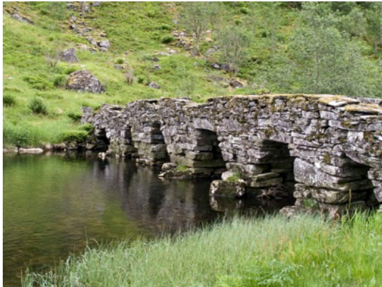
Bilete: Gamle Ytredal bru i Vadheim

kulturminne ved fjorden frå tida då sjøen var ferdselsåra og nytta til fiske.