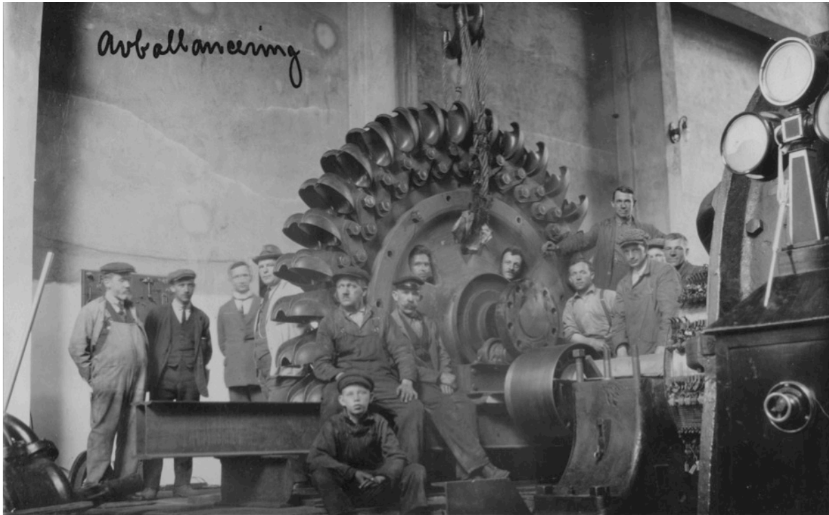
Bilete: Arbeidarar og funksjonærar i kraftstasjon 1