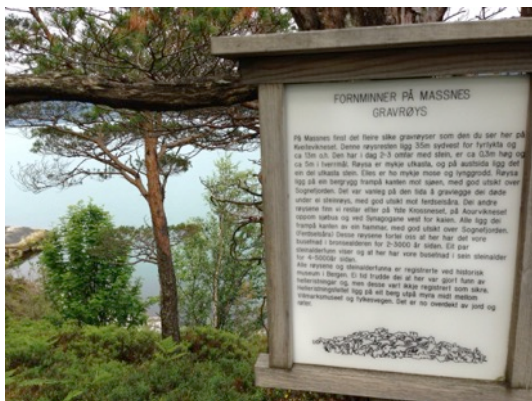
Bilete: Fornminna er ein del av naturstien til Massnes Vilmarksmuseum

Riksantikvaren sin nettportal Kulturminnesøk www.kulturminnesok.no er den allmenne nettstaden for formidling av informasjon om faste kulturminne. Men det er fleire metodar å formidle og innhente informasjon om kulturminne på.