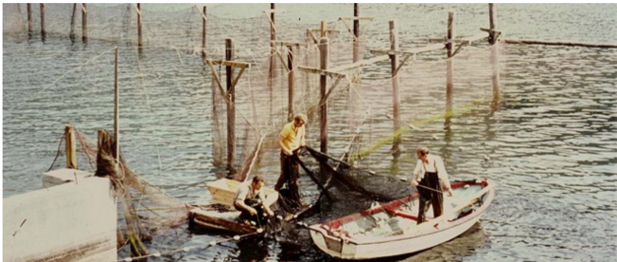
Bilete: Osland Havbruk var på tidleg 60-talet under namnet Osland Ørretoppdrett (seinare Eros Laks) stifta av oppdrettspioneren Erling Osland

på begge sider av fjorden. I 1900 var veden framleis ei viktig handelsvare og energikjelde. I 1930 var aluminium produsert ved hjelp elektrisk straum frå vasskraft den viktigaste eksportvara og inntektskjelda. Først i 1960 hadde dei aller fleste husstandane i området vårt fått innlagt straum.