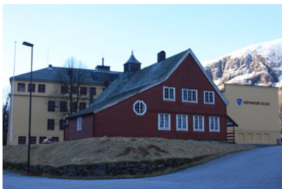
Bilete: Valhall – forsamlingslokale til Høyanger Ungdomslag

Det store fleirtalet av kulturminna i Høyanger kommune er i privat eige, der eigar/grunneigar har skjøtsels- og vedlikehaldsansvaret. Eigarane tek vare på kulturminna og kulturmiljøa sine fordi dei betyr noko for dei, eller fordi dei har ein bestemt funksjon. Det er deira innsats, vilje, kompetanse og erfaring som er avgjerande for om kulturminna/kulturmiljøa blir ivaretekne på en god måte. Mange frivillige lag- og organisasjonar er og eigarar av viktige kulturminne. Forvaltning av nokre av desse private kulturminna kan vere sær