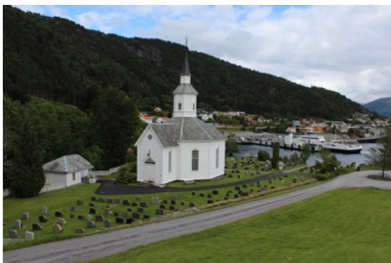
Bilete: Lavik kyrkje

Kyrkjene har ein spesiell status som kulturminne. Alle kyrkjer bygd mellom 1650-1850 har status som listeførte kyrkjer, desse er ikkje freda, men er sett på som verneverdige. Nokre kyrkjer som er sett opp etter 1850 er og listeførte. For Høyanger kommune sin del har Lavik kyrkje (1865), Kyrkjebø kyrkje (1869) og Ortnevik kyrkje (1925) slik status. Listeføringa inneber mellom anna att inngrep i eller endringar av kyrkjene skal avklarast med Riksantikvaren. Tiltak i eller i utomhusanlegg skal også avklarast med Biskopen i Bjørgvin.