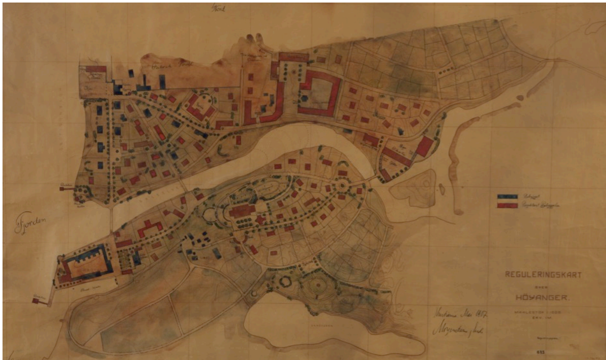
Bilte: Byplanen frå 1917 av arkitektane Morgenstjerne & Eide