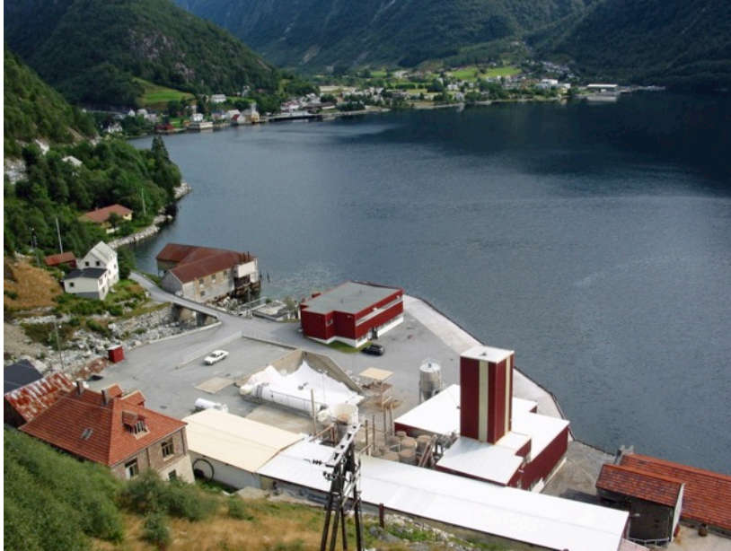
Bilete: Vadheim i 2006 med AS Vadheim Elektrochemiske Fabriker nærmast