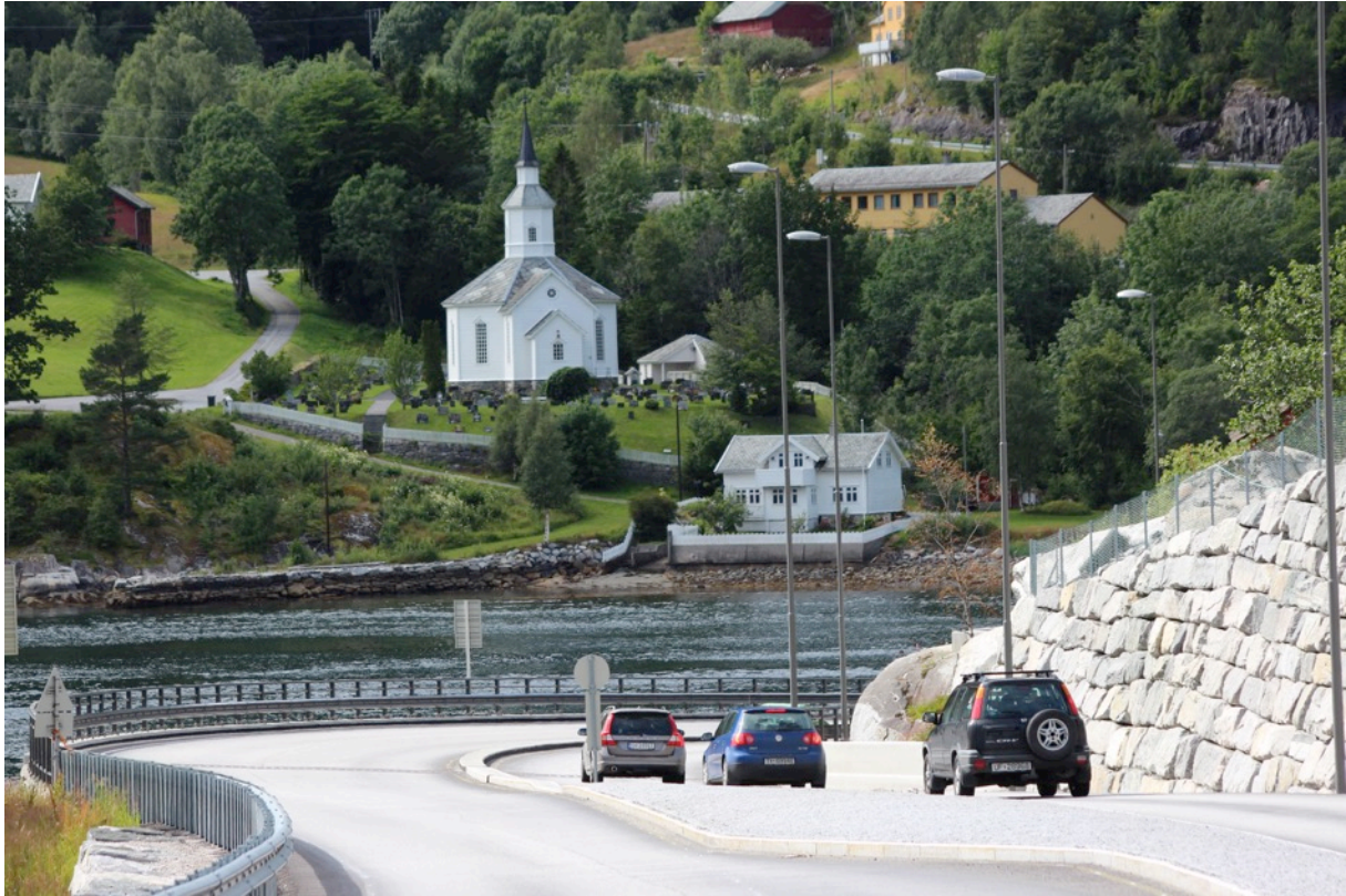
Bilete: Transformerte Lavik til ny tid og ferjeplass